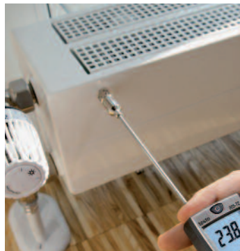
Измерения поверхностной температуры радиатора