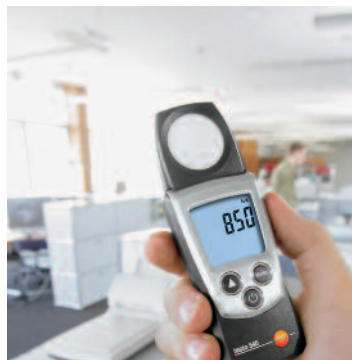
Измерение интенсивности освещенности на рабочих местах