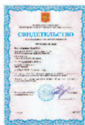
Приборы внесены в Государственный Реестр Средств Измерений РФ. Данные сертификатов приведены под каждой моделью.