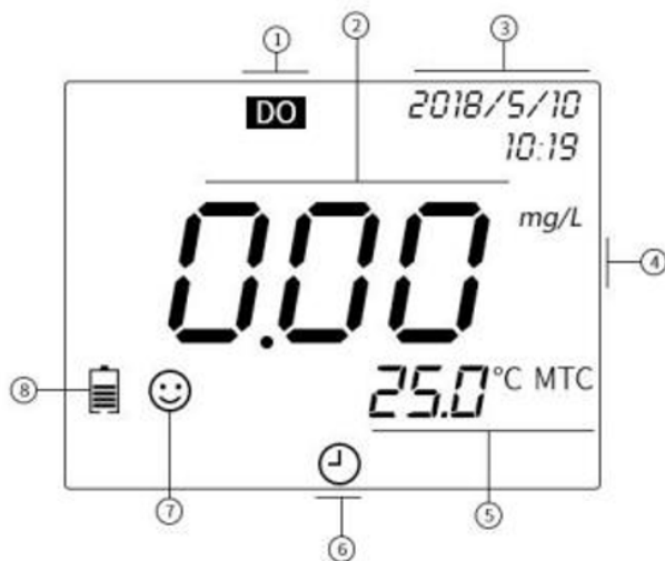
Рисунок 2 - Цифровой дисплей анализатора Altimax.