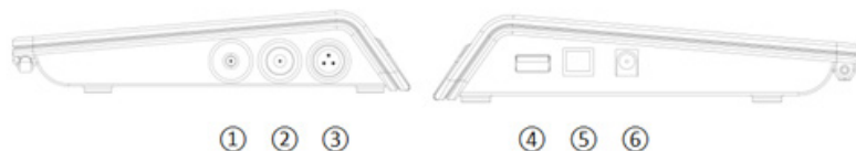
Рисунок 2 - Разъемы подключения анализатора Altimax