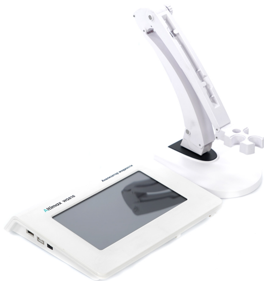
Рисунок 1 - Общий вид анализатора Altimax

Органы управления анализатором жидкости Altimax представлены на рисунках 1, 2.