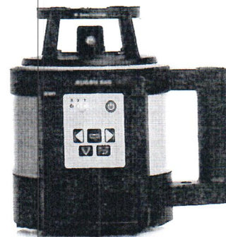
Leica Rugby 840

Пломбирование крепёжных винтов корпуса нивелиров лазерных ротационных Leica Rugby серий 600, 800 не производится, ограничение доступа к узлам обеспечено конструкцией крепёжных винтов, которые могут быть сняты только при наличии специальных ключей.