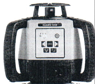
Leica Rugby 640