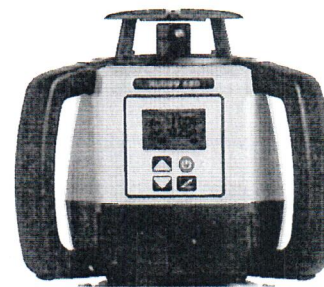
Leica Rugby 670 Leica Rugby 680