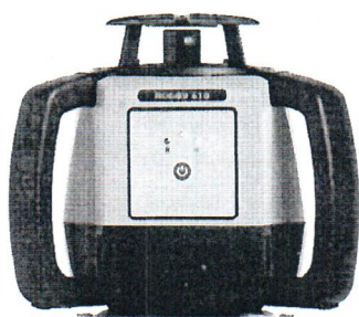
Leica Rugby 610

Общий вид нивелиров лазерных ротационных Leica Rugby серий 600, 800: