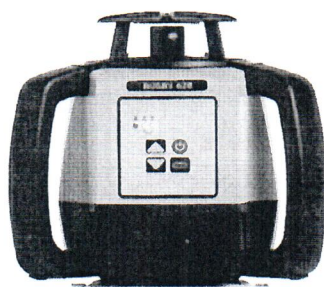
Leica Rugby 620