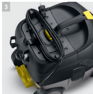
3 Практичное хранение кабеля