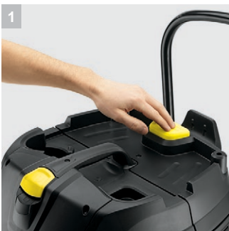
1 АрClean (система полуавтоматической очистки фильтра)

Профессиональный пылесос влажной и сухой уборки 25/1 Ap - это мобильный и компактный аппарат оснащенный системой полуавтоматической очистки плоского складчатого фильтра обеспечивающей возможность длительной и непрерывной работы без потери силы всасывания, представляет собой нашу начальную модель класса Ap. Оснащен 25-литровым мусоросборником.