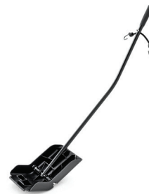
ЗАГЛУШКА BIOCLIP ДЛЯ СТ 154 (97CM) ДЛЯ МОД. С 2011 Г.В. 960 71 00-38