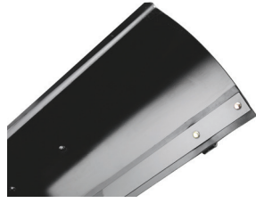
TRO059 - RUBBER SCRAPER 966 00 19-01