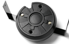
TRO057 - COUNTERWEIGHT CT 580 38 97-01