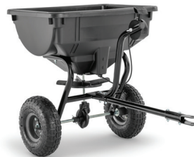
РАЗБРАСЫВАТЕЛЬ-СЕЯЛКА 30KG 589 40 93-01