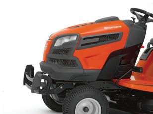
BRUSH GUARD 505 56 88-13