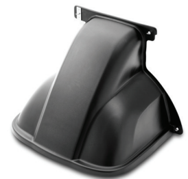
ДЕФЛЕКТОР 960 71 00-41