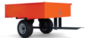
ПРИЦЕП PROFİ 953 51 17-02