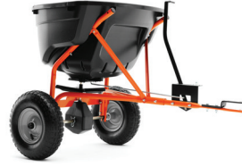
РАЗБРАСЫВАТЕЛЬ 967 02 72-01