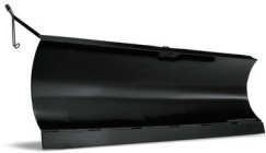
TRO038 - SNOW FRONT BLADE 122CM 544 92 17-01