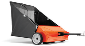
МУСОРОПОДБОРЩИК/ ТРАВСОБОРНИК 586 63 65-01