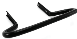
БАМПЕР 954 12 00-49