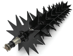
AERATOR 586 63 69-01