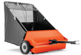
SWEEPER 582 71 99-01