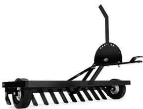
GRAVEL HARROW 953 51 24-01