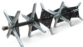
PLUG AERATOR 588 21 27-01