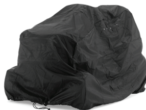
ЧЕХОЛ ДЛЯ ТРАКТОРА 505 63 08-80