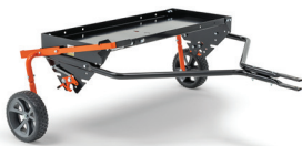
ATTACHMENT PLATFORM 586 63 72-01