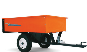
ПРИЦЕП 275 501 00 82-01