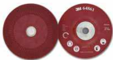
Оправки для кругов на фибровой основе