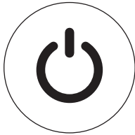
Кнопка ON/OFF для модели AP-100